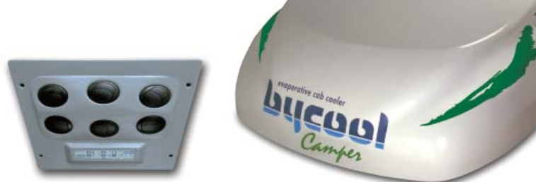
Cubretapizado con distribuidores de aire y panel de control